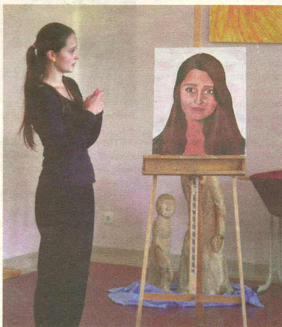
Úspěšná škola Podle ředitelky waldorfské školy si děti a studenti věří, mají sebevědomí a všeobecný rozhled.

Tato škola se umístila nejen na třetím místě, ale předbehla všechny školy, které vyučují ekonomické studijní obory. „Vysvětluji si to tím, že si škola dlouhodobě udržuje postavení svými vyššími nároky na žáky oproti školám s podobnými obory, a to i přes nepříznivý demografický