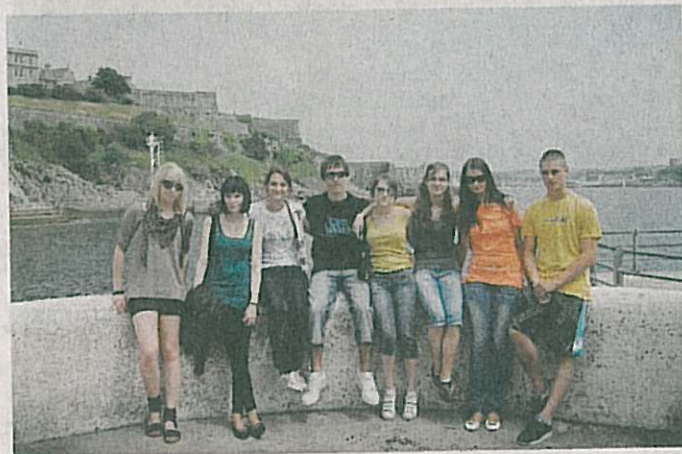
NA PROMENÁDĚ V PLYMOUTHU. S kamarády ze školy se někdy setkávala studentka po práci ve městě.