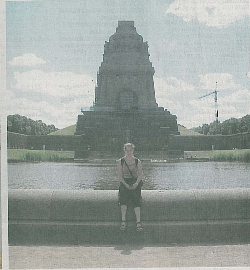
Studentka jablonecké Obchodní akademie strávila na praxi v Německu čtyři týdny. Kromě práce ve firmě zabývající se prodejem navštívila i zajímavá místa.