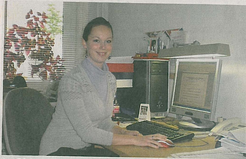
Pracoviště jablonecké studentky během její čtyřtýdenní praxe v Německu.

Jako studentka druhého ročníku VOŠ v Jablonci nad Nisou jsem musela absolvovat praxi. Díky podnikavosti naší školy a především díky programu Leonardo da Vinci, jsem tuto praxi mohla vykonat v zahraničí. Konkrétně v Německu, v největším městě spolkové republiky Sachsen – v Lipsku.