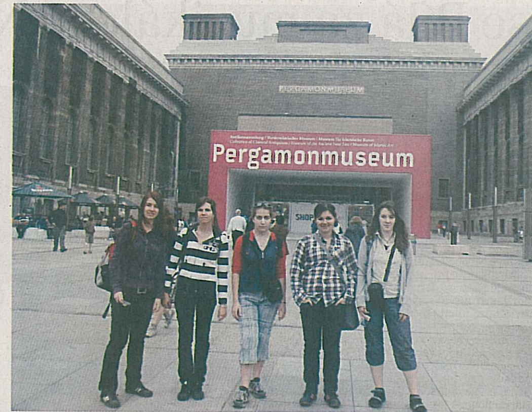
Na zkušené v Německu navštívily jablonecké studentky také Pergamonmuseum v Berlíně.

Na praxi jsme měly z grantu EU hrazeno ubytování,