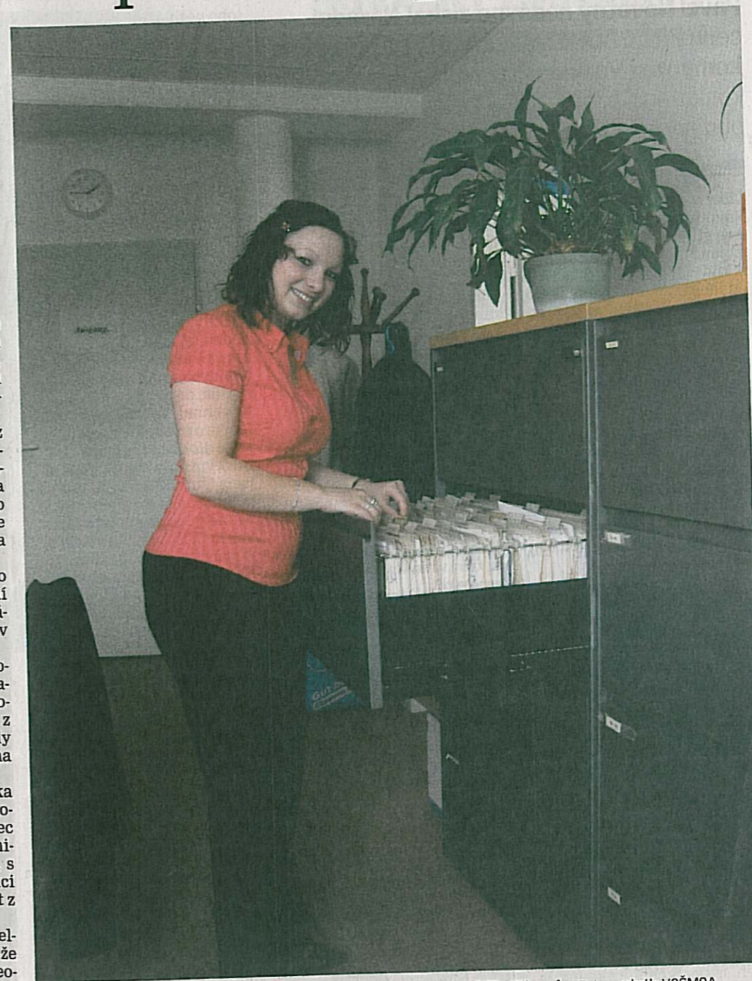
Studentka z Jablonce nad Nisou sbírala zkušenosti v daňové kanceláři v Německu.