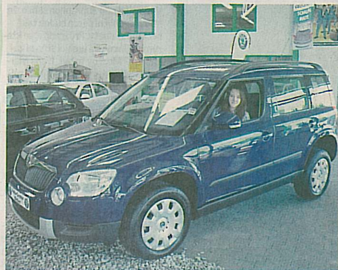
Studentka na praxi v Lipsku občas přihlížela prodeji aut.

stravování, MHD a cestovní pojištění. Dostaly jsme také finance na další stravování.